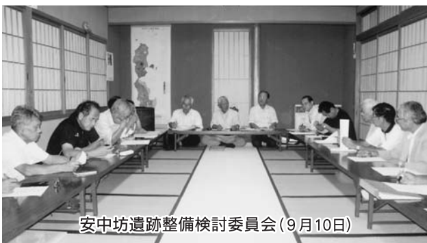
安中坊遺跡整備検討委員会(9月10日)

本年度は跡地管理が容易にできるよう整地を行います。今後の利用方法については、介護予防公園も含め、地元吉川区民の意見を賜わりながら検討していきます。安中坊の歴史を伝えられるような、地域とまちづくりの方向性を見出しただければと考えています。