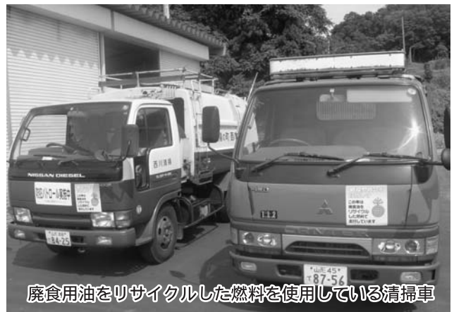
廃食用油をリサイクルした燃料を使用している清掃車

チップ材を利用したバイオマスストーブ、あるいはボイラーの利用について、統合小学校での利用も検討しましたが、機器類が極めて高価なこと、管理の