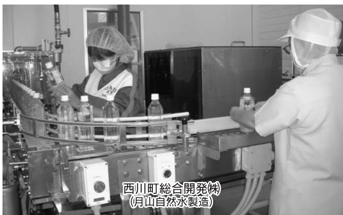
西川町総合開発(株) (月山自然水製造)