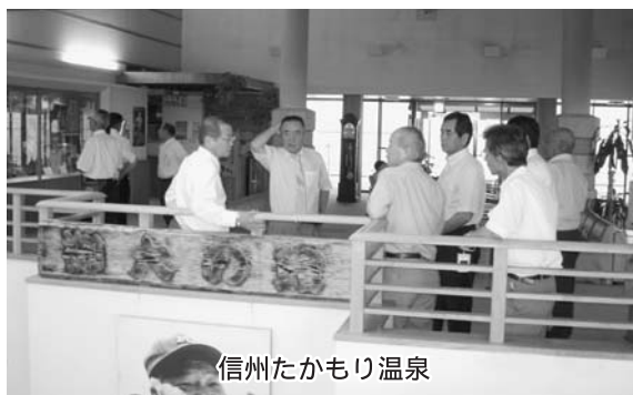
信州たかもり温泉