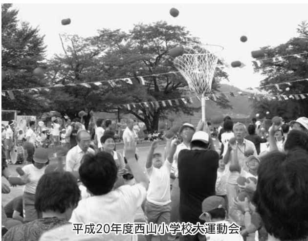
平成20年度西山小学校大運動会

策は、風除室や雁木を利用した専用通路の設置を計画しており、強風にさらされたままにはならない計画です。プールについては、現在の各小学校の利用状況から判断して利用日数も十分に確保されます。不審者対策は、体育館、グラウンドともに現在と同様の利用形態になりますが、図書館等については、設備及び人的体制等の整備を図っていきます。安全柵等については、環境にマッチしたフェンスを設置し、出入口等危険箇所には施設も必要と考えています。