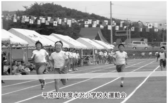
平成20年度水沢小学校大運動会