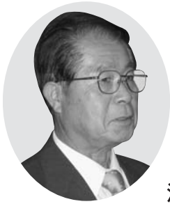
池上 博 議員