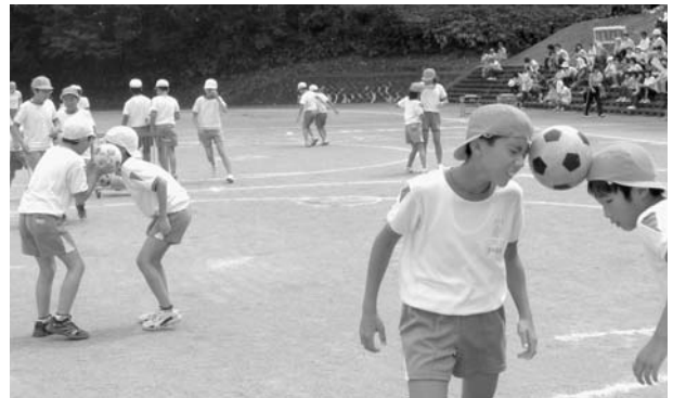
第61回吉川区民大運動会