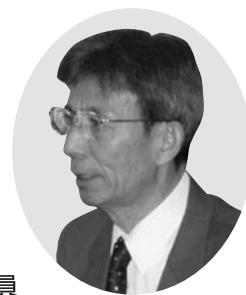
渋谷 雄三郎 議員

第5次総は定住人口の維持確保を中心に計画されていますが、拠点地整備事業以外の事業の財源的な裏づけの提示を。 また、統合小学校町民検討会の意見や要望を基本設計にどのように反映されますか。