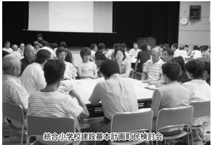
統合小学校建設基本計画町民検討会

害が発生している折、川沿いの統合小学校用地を適地とする根拠は、いまからでも高い所に変更すべきでは。