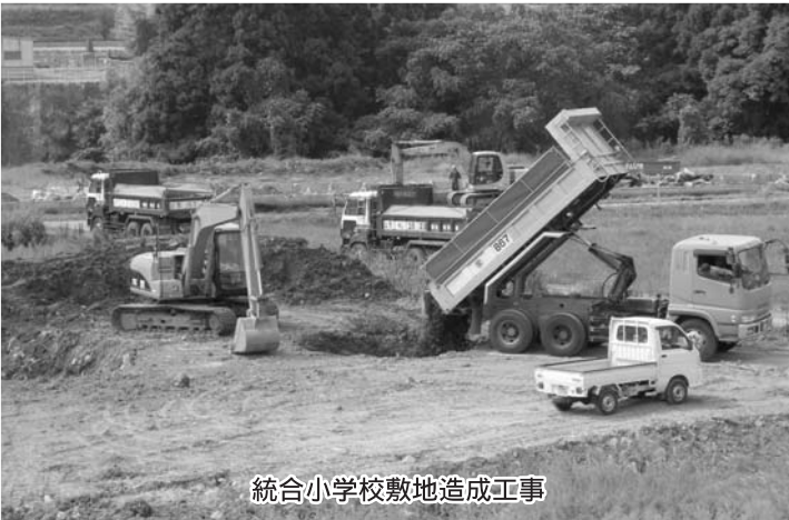
統合小学校敷地造成工事

統合小学校の敷地造成工事が始まり、建設に向けて動き出しました。26億円の投資が地元経済に貢献できるようにする施策が必要と考えます。（敷地造成工事の金額等詳細は、14ページの臨時会をご覧ください。）