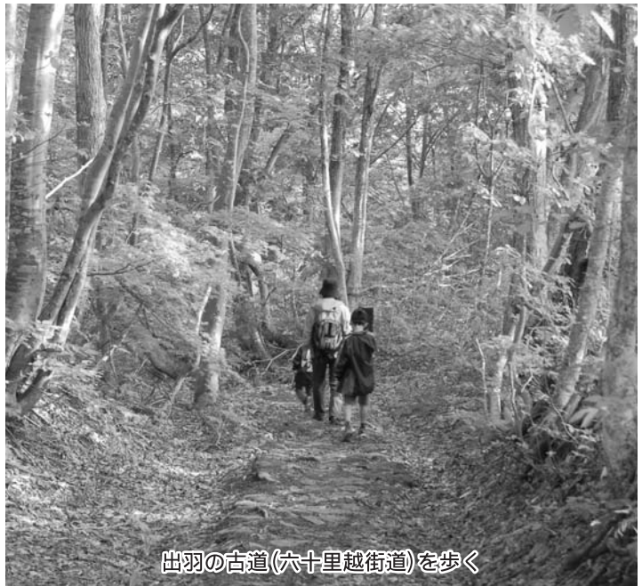
出羽の古道(六十里越街道)を歩く

本町は観光資源に恵まれ、観光開発を進めてきましたが、近年、旅行形態が団体から個人や小グループ化し、観光客のニーズも変わってきました。今後の観光開発をどう進めますか。月山夏スキーは、宿泊客が減少しており、今後、月山の観光資源の活用策をどう考えていますか。