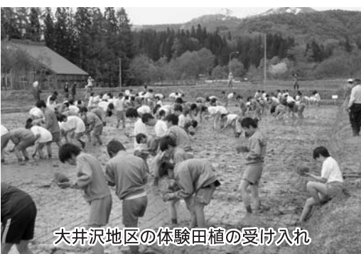
大井沢地区の体験田植の受け入れ

直売所の盛況ぶりなど、観光客のニーズは多様であり、現在は本町産の山菜等の特産品に、山葡萄、こくわの加工、さらには間伐材利用の玩具等の開発もなされ、好評を得ています。関係者と連携しながら、本町の素材を活かした土産品開発を推進します。