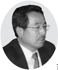
古澤 俊一 議員