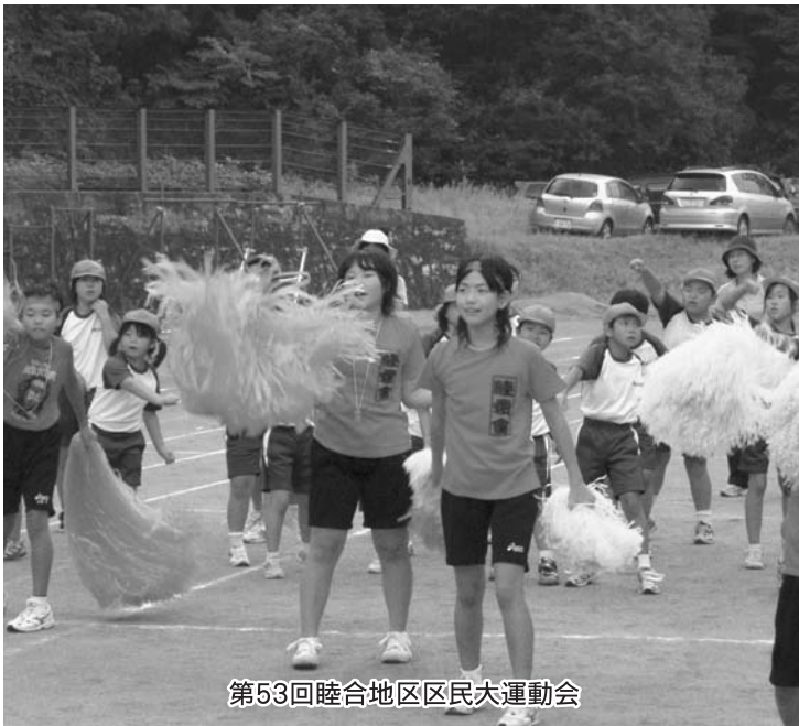
第53回睦合地区区民大運動会