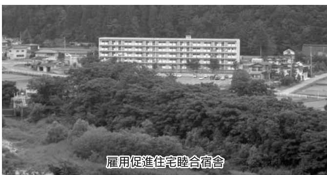
雇用促進住宅 睦合宿舍

国は当初、平成33年までにすべての処理を完了すると閣議決定していました。しかし、その後、処理業務が加速され、平成20年度末までに譲渡希望の確認要請があり現在、独立行政法人雇用・能力開発機構と譲渡条件について協議を進めており、これらを踏まえて判断します。 町営アパート建設については、町道間沢海味線の拠点地整備構想に基づき、具体的事業の内容、財政計画を検討する中において進めています。