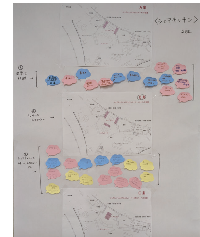
シェアキッチングループ