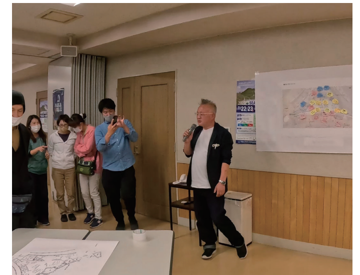
出合ったアイデアをみんなに発表しました