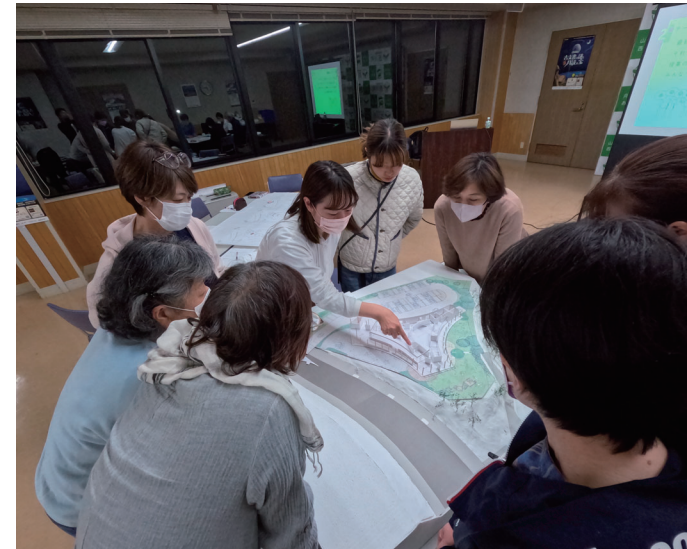
模型を活用しながらグループごとに議論しました

・この施設の本来の役割である「サテライトオフィス」機能について、町全体のまちづくりやこれから整備予定のテレワーク施設とのつながりについて議論します！