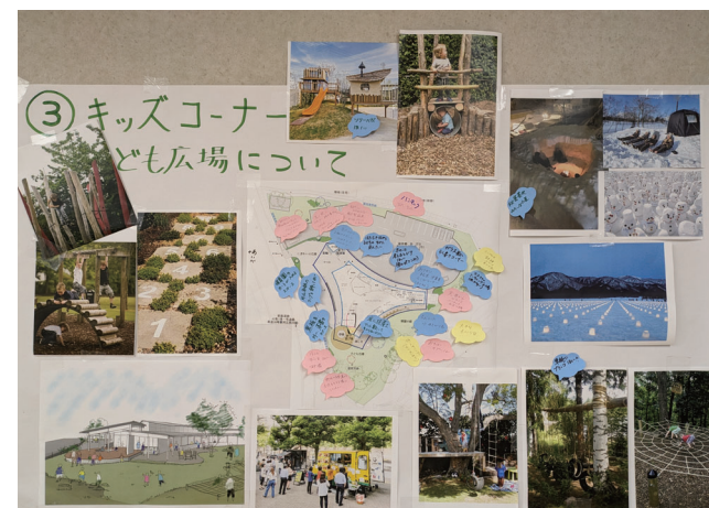
キッズコーナー・子ども広場グループ