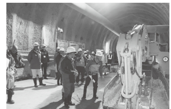
▲重機を間近で見る参加者