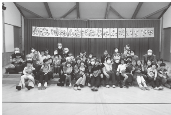
▲大好きなおじいちゃん・おばあちゃんと一緒に

「いつもありがとう 祖父母参観」 11月10日 おじいちゃん、おばあちゃんをお招きして行われた祖父母参観。体を動かすのが大好きな子どもたちと一緒に、果物列車、フルーツバスケットなどを楽しみました。子育ては1人ではできません。おじいちゃん、おばあちゃんのサポートは本当にありがたいです。子どもたちも大好きです。これからもよろしくお願いします。