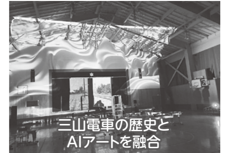
三山電車の歴史とAIアートを融合

凍てつく寒さの中、間沢ミニデいの皆さまや町民の皆さま、米沢市長、樺津県議・阿部県議・橋本県議や関係企業さんにお越しいただき、1200名以上の来場がありました!ボランティアや職員の皆さん、本当にありがとうございました!来年も頑張ろう🔥