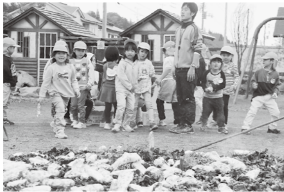
▲たき火に準備したいものを投げ入れました