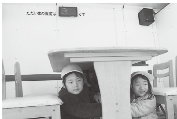
▲じつと揺れがおさまるのを待ちました

「いつもありがとう 祖父母参観」 11月10日 おじいちゃん、おばあちゃんをお招きして行われた祖父母参観。体を動かすのが大好きな子どもたちと一緒に、果物列車、フルーツバスケットなどを楽しみました。子育ては1人ではできません。おじいちゃん、おばあちゃんのサポートは本当にありがたいです。子どもたちも大好きです。これからもよろしくお願いします。