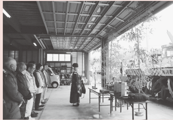
▲除雪作業の安全を祈願

11月17日、水道管理センター駐車場にて、西川町除雪安全祈願祭及び除雪車の出動式が行われ、関係者らが作業の無事故を祈願しました。その後、にしかわ保育園で年長児が除雪車の乗車体験を行い、除雪車の窓から見下ろす景色に子供たちからは歓声が上がりました。