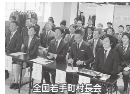
全国若手町村長会

全国926町村のうち49歳までに当選した町村長は67人(11/15時点)で、このうち45人が参加。年齢は、37～53歳、女性は3人。各町村長がネットワークを組み、要望するところは要望し、つながるところはつながり、人口減少や少子高齢化、自然災害の激甚化など共通の課題に取り組んでいきます。山形県からは、山辺町長、大石田町長にもご参加いただきました!