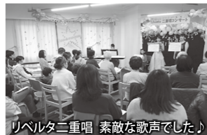
リベルタ二重唱 素敵な歌声でした♪

11月19日に西川小図書館で Fun Time Library (ファンタイムライブラリー) 2023 が開催されました。午前の部はサークルピーつくによるおなはなし会と工作教室、午後の部は Liberta (リベルタ) による二重唱のコンサートを行いました。工作教室では約41名が参加し、ギターを作りました。それぞれ個性の光る作品に仕上げていました。