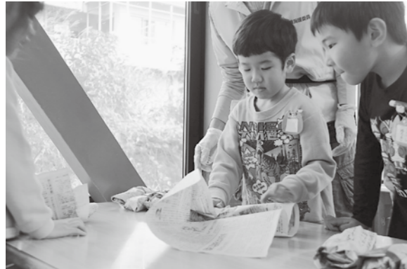
▲民生委員の方に教えてもらいながらやきいもの準備をしました