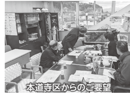
本道寺区からのご要望

11月13～14日、各区の区長はじめ役員の方々にお越しいただき、ご要望を承りました。要望に至るまで、区内で対話を重ねてとりまとめいただき、ありがとうございます。切実なご要望(各地区2つまで)は、しっかり実行できるような区の皆さまと現地で対話し、できるだけ来年度の予算に加える形で予算をつかっていきたいと思っております。やっぱり、現地ですね!