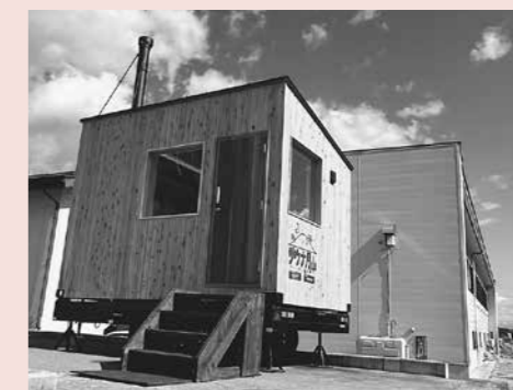
▲移動式トレーラーサウナ

町が町内産材を活用して製作した移動式トレーラーサウナを、11月17日に般社団法人月山朝日観光協会が930万円で落札しました。 今回は、町が積極的に進めているサウナファン呼び込み策を二層加速させようと、このサウナや町内の雄大な自然環境を活用し、年1回以上、町内でイベントやツアーを実施することを条件にした一般競争入札の形をとったものです。 観光協会では、すでに実施しているテントサウナと合わせて、移動式トレーラーサウナを活用したイベントを皮切りに、関係人口の