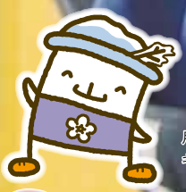
月山朝日観光協会イメージ キャラクター「ガッさん」