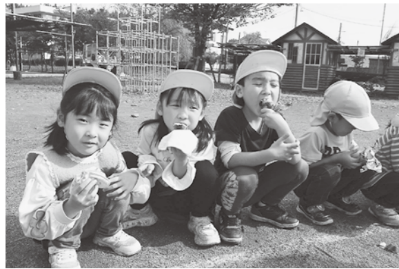
▲ホクホクのやきいものを口いっぱい頬張りました

「やきいも」 11月2日 秋晴れの中、たき火をして、「やきいも」が行われました。今では、火を見る機会も少なくなつた中で、大きな炎や木が燃える過程を見ることは、子どもたちにとって、貴重な体験となつていきます。やきいもはほっこり美味しく出来上がり、できたてをみんなで一口ずつ味見をして、3時のおやつでいただきました。