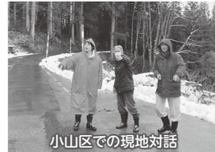
小山区での現地対話