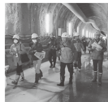
▲トンネル内を見学

11月11日、志津地区において、町民を対象とした排水トンネルの現場見学会が開催されました。 この排水トンネルは、「抑制制工」の一つで、地すべりを防ぐため、地下に溜まっている水を排水することを目的に造られています。 当日は、新庄河川事務所寒河江川砂防出張所、(株)森本組のご協力のもと、トンネル内や使用されている重機の見学、排水トンネル工事の説明などを受けました。