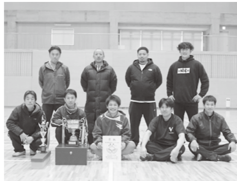
▲優勝した海味Aチームの皆さん