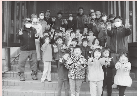
▲西川町除雪隊とにしかわ保育園年長児の皆さん

11月17日、水道管理センター駐車場にて、西川町除雪安全祈願祭及び除雪車の出動式が行われ、関係者らが作業の無事故を祈願しました。その後、にしかわ保育園で年長児が除雪車の乗車体験を行い、除雪車の窓から見下ろす景色に子供たちからは歓声が上がりました。