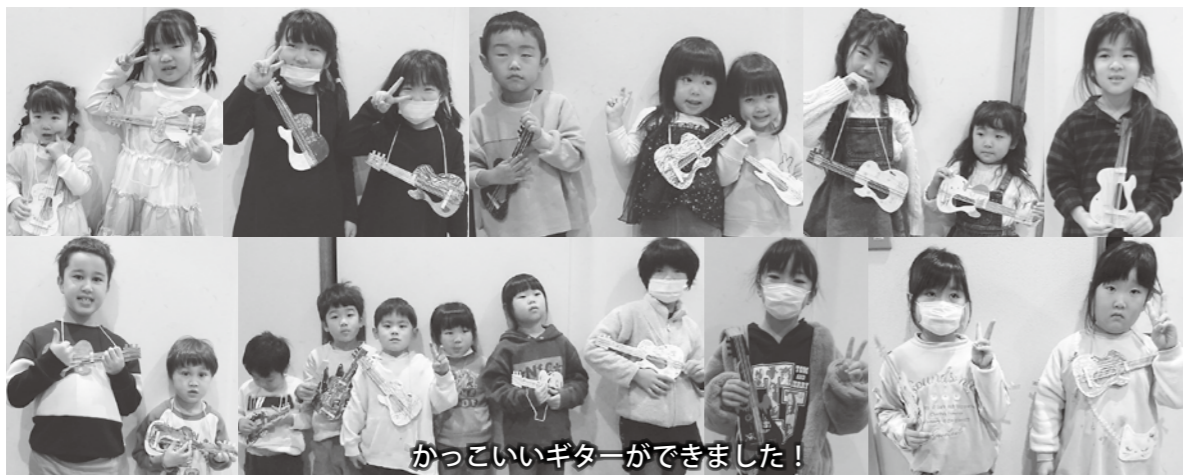
かっこいいギターができました!