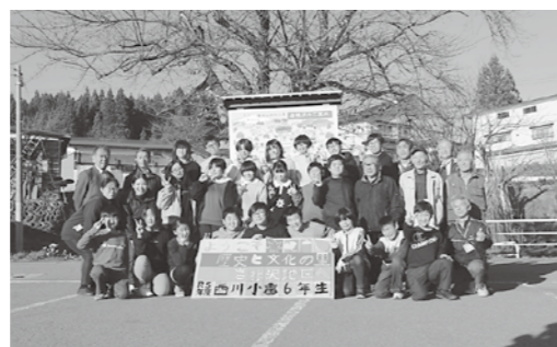
▲思いをこめて制作した看板と

ふるさと楽行での学びをいかに、岩根沢の魅力を多くの人々に伝えるため、西川小6年生23人が看板を作成し、その設置式が11月21日、三山神社駐車場で行われました。 看板には地域材の西山杉を使用。財源にはやまがた環境税を活用しました。17cm角の板に一人一文字を彫刻刀で彫り、それらを合わせて一枚の看板に仕上げました。看板は今後同駐車場に設置されますので、ぜひ足を運んでみてください。