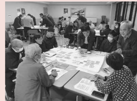
▲新しいアイデアを一緒に考える

町の観光は、AI謎解きゲームや種類豊富なサウナ事業など、これまでない展開をみせ始めています。この広がりの中から、今回はテーマを「持続可能な西川らしいイベント・アクティビティ・観光誘客拠点づくり」と「町政70周年記念事業」の二つにしぼり、11月16日に対話会を開催。対話会には、35名の皆さんが参加し、数多くの意見を出していただきました。 今回の対話会で出されたご意見は、今後の観光戦略に活かしていきます。