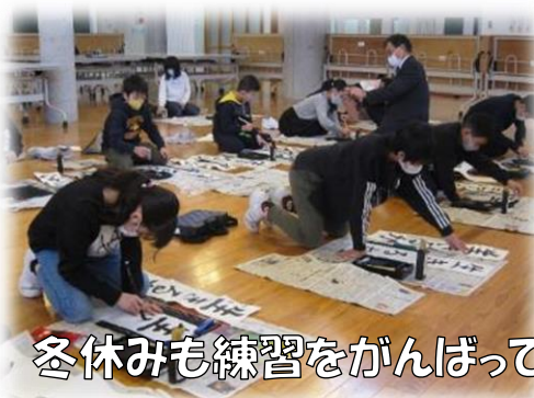
冬休みも練習をがんばってきました