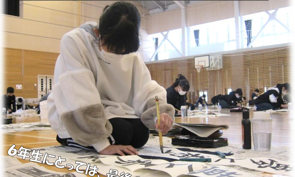
6年生にとっては、最後の書き初め大会