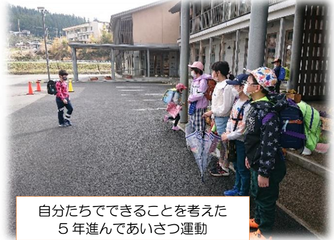
自分たちでできることを考えた 5年進んであいさつ運動

今年度がスタートしてもうすぐ2か月。4月に入学した1年生もすっかり西川小学校の生活に慣れてきました。主体的に学ぶ児童をめざし学習活動が進んでいます。自ら考え取り組む姿が見られます。これからは、粘り強く取り組み考えを深めていける場面をたくさん創っていきたいと思います。そして、困難なことに立ち向かうたくましさも育てていきます。