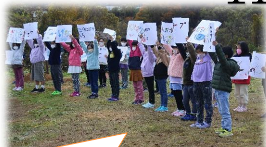
2年生が、お願いを発表しました。