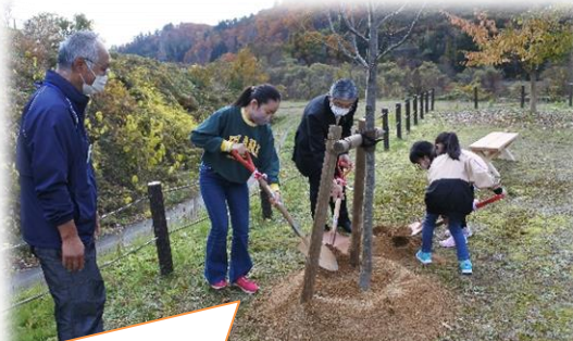
ナナカマド、ミズナラ、コナラを植樹しました。

この度、西川町産業振興課のお力添えがあり「やまがた森林と緑の推進機構」の助成金を活用しビオトープを整備しました。その完成式典を11月15日に、県関係、ローソン関係、町関係、海味区関係、学校運営協議会関係の方に参列いただき行いました。増えてしまった植物を整理したり、水辺の植物を植え直したりビオトープがバージョンアップしました。整備していただいたおかげで、生き物の様子が観察しやすくなり、継続的に学習の場として活用できます。また、3本の木を植え、ベンチを置くことで、憩いの場の機能も充実させました。今年植えた花が、来年、きれいに咲くことを楽しみにしています。ぜひ、見にいらしてください。