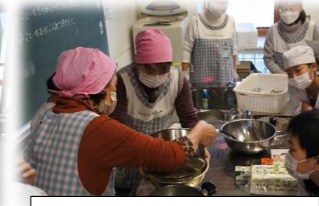
5年家庭科味噌汁づくり 講師 西川町食生活改善推進委員会