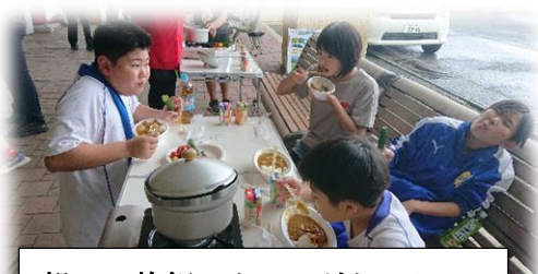
鍋での炊飯! カレーがおいしい