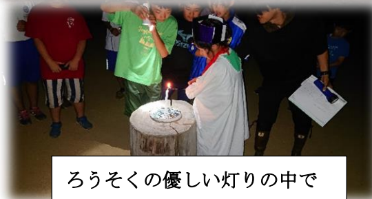
ろうそくの優しい灯りの中で