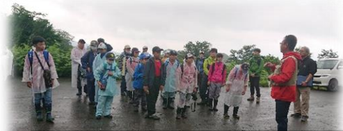
雨の中のフラワートレッキング