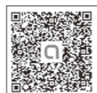
▲オープンチャット